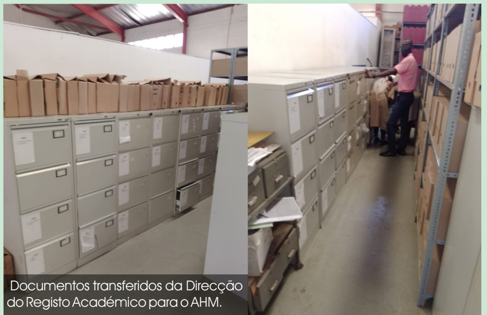
Documentos transferidos da Direcção do Registo Académico para o AHM.

arquivamento de processos de novos ingressos à UEM.