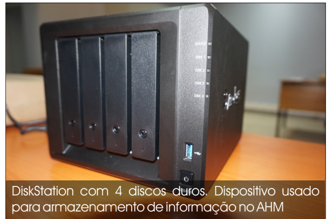
DiskStation com 4 discos duros. Dispositivo usado para armazenamento de informação no AHM

Sónia Tamele: Temos feito backups sim, fazemos normalmente 3 cópias e guardamos em 3 locais físicos diferentes. A periodicidade depende de cada situação, há instituições que fazem diariamente, semanalmente até mensalmente. No AHM fazemos os backups periodicamente.