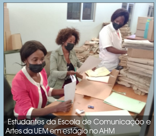
Estudantes da Escola de Comunicação e Artes da UEM em estágio no AHM

três meses, as actividades incidem no tratamento de documentos com destaque para a Higienização, acondicionamento, descrição e inventariação nos Departamentos de Arquivos Permanentes, Arquivo Central da UEM e na Repartição de Conservação e Restauro.