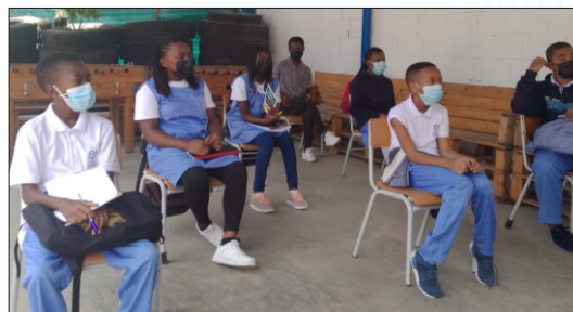
Alunos do Colégio Global durante a Palestra sobre Heróis moçambicanos

A terminar fez menção de outras formas de reconhecimento que o Estado moçambicano concede aos cidadãos por seus feitos notáveis através da Comissão Nacional de Condecorações e Títulos Honoríficos.