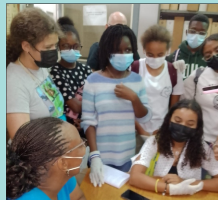
Alunos da Escola Francesa em visita a Iconoteca do AHM

audiovisuais sob custódia na Repartição como mapas, cartas topográficas, microfímes, películas, selos, cartazes e perceber como são organizados, preservados e acessados.